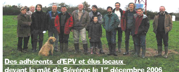
Des adhérents d'EPV et élus locaux devant le mât de Sévérac le 1 er décembre 2006