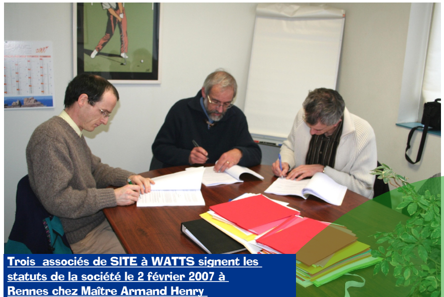
Trois associés de SITE à WATTS signent les statuts de la société le 2 février 2007 à Rennes chez Maître Armand Henry (avocat d'affaires).

Les futurs associés de la SARL pourront répartir leurs apports en capital et en comptes courants bloqués . En outre il sera appliqué un coefficient de revente du ou des